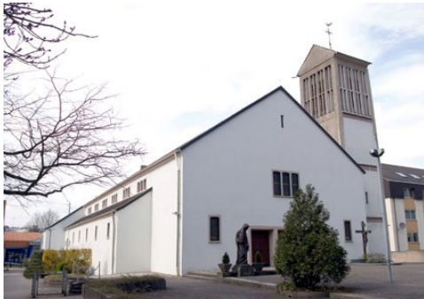
St. Theresia Schafbrücke/Bischmisheim