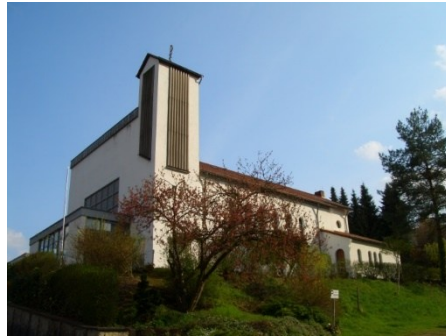
St. Ursula, Scheidt