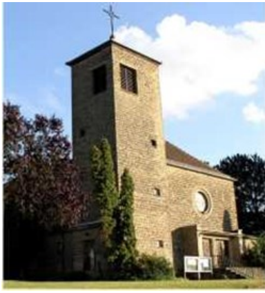
Hl. Familie, Rentrisch